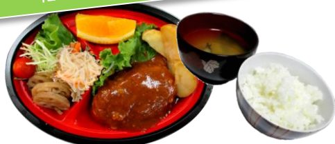
低アレルギーメニュー①

デミグラスハンバーグ フライドポテト 春雨サラダ 蓮根金平 果物 他 ご飯 味噌汁