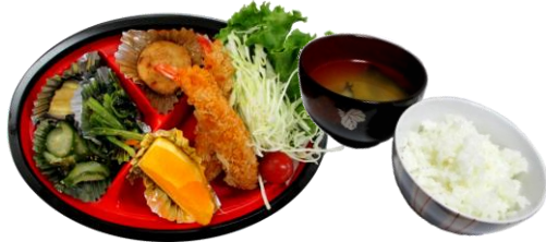
低アレルギーメニュー②

デミグラスハンバーグ フライドポテト 春雨サラダ 蓮根金平 果物 他 ご飯 味噌汁