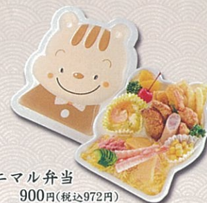
アニマル弁当 900円(税込972円)