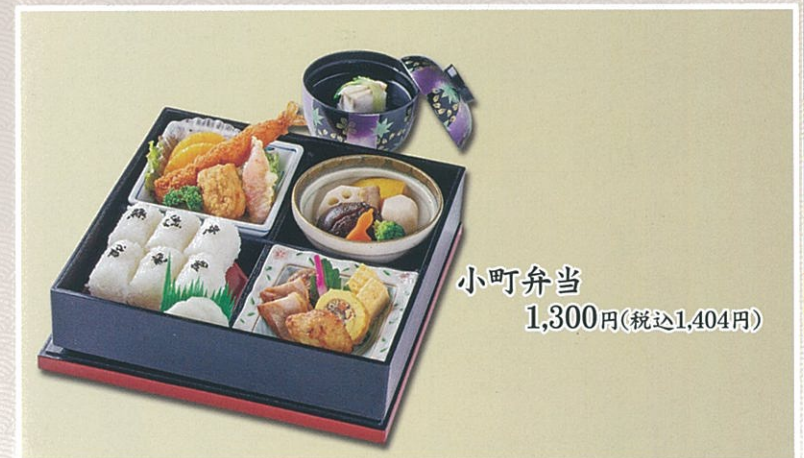
小町弁当 1,300円(税込1,404円)