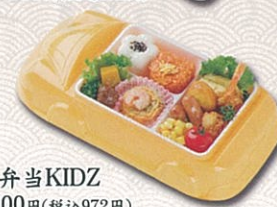
お子様弁当KIDZ 900円(税込972円)