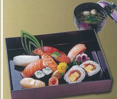
上盛合せと吸物 1,600円(税込1,728円)