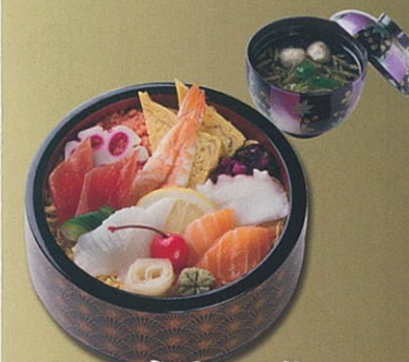
チラシ寿司と吸物 900円(税込972円)