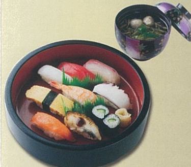
にぎり寿司と吸物 1,100円(税込1,188円)