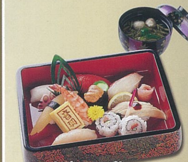
上にぎりと吸物 2,100円(税込2,268円)