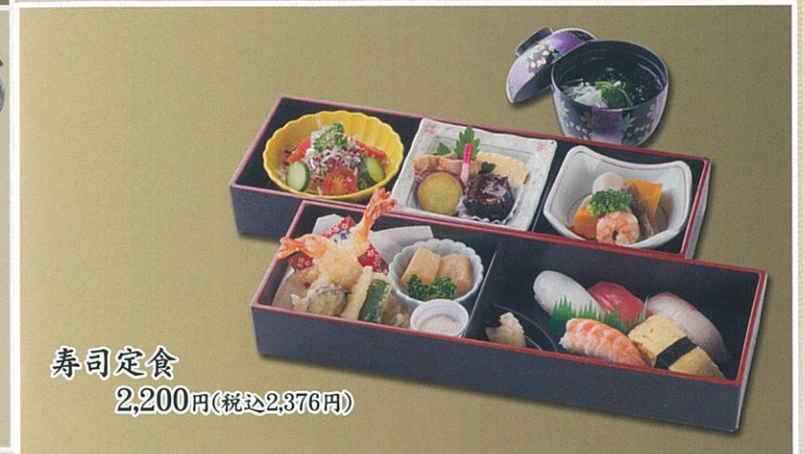
寿司定食 2,200円(税込2,376円)