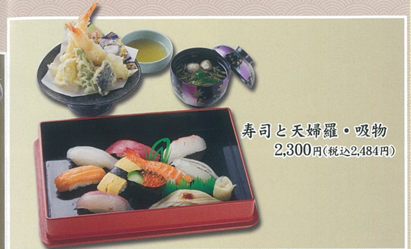
寿司と天婦羅・吸物 2,300円(税込2,484円)